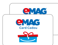
Card cadou eMAG 1000 lei