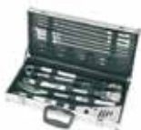
Set grătar De Luxe