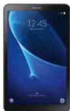
Tabletă Samsung Tab A T580