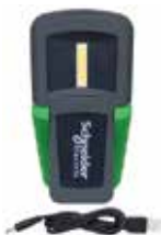
Lanternă cu LED Thorsman Mini