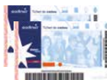
Tichet cadou 1000 lei*

*Îți vei putea comanda acest premiu doar dacă ești înscris ca persoană fizică.