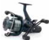
Mulinetă Shimano Baitrunner