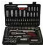
Trusă profesională de scule, 108 piese