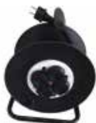
Prelungitor cu tambur Well, 50 m