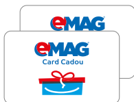
Card cadou eMAG 200 lei