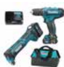
Pachet Makita mașină de găurit + mașină multifuncțională + 2 acumulatori + încărcător + tool set