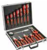
Geantă metalică cu 13 scule