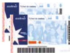
Tichet cadou 200 lei*

*Îți vei putea comanda acest premiu doar dacă ești înscris ca persoană fizică.