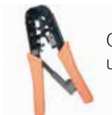
Clește sertizare universal Roline