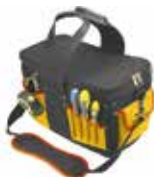
Geantă pentru scule Topex